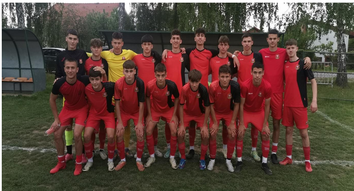
Momčad kadeta HNK Gorica