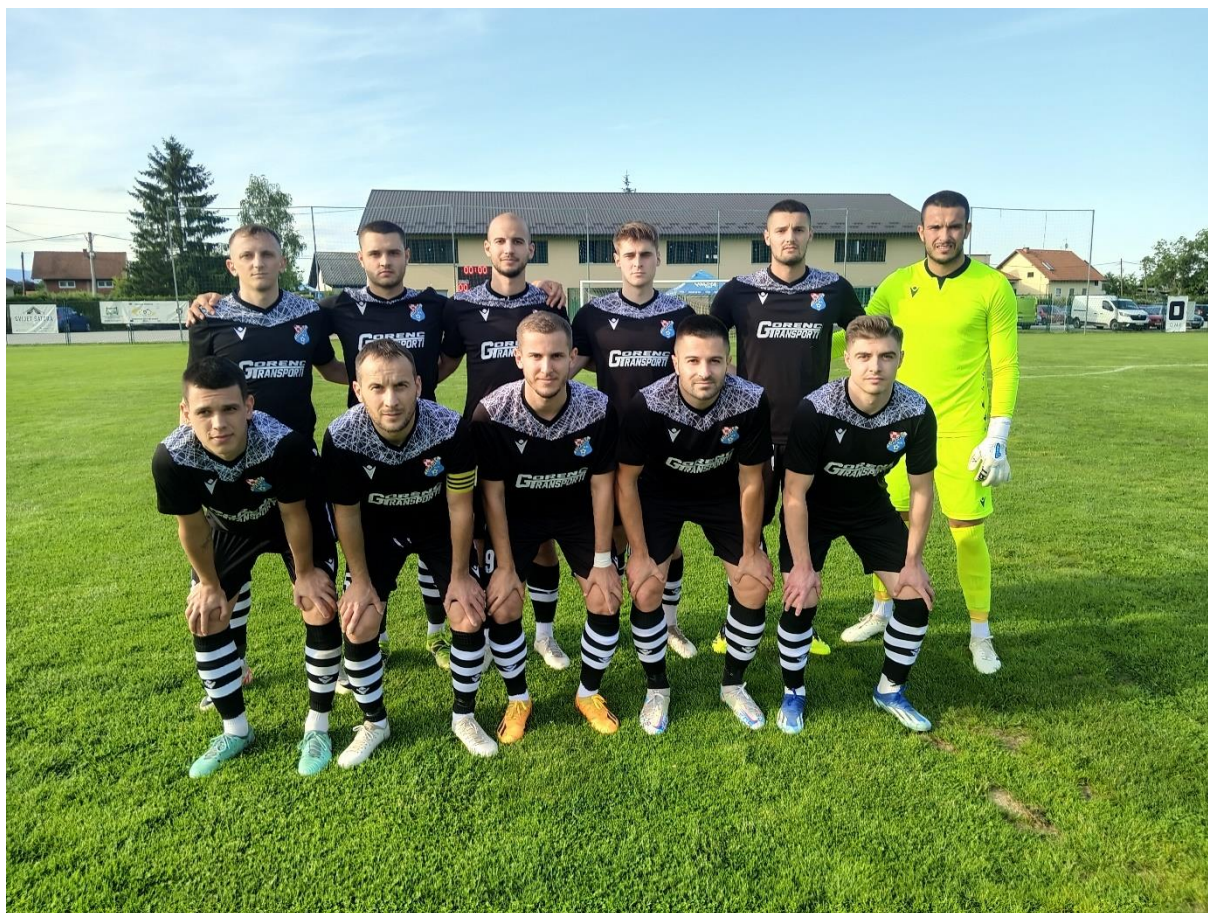
Momčad seniora NK Lukavec

Povjerenik KUP natjecanja: Stjepan Petrac - 098/18 14 689