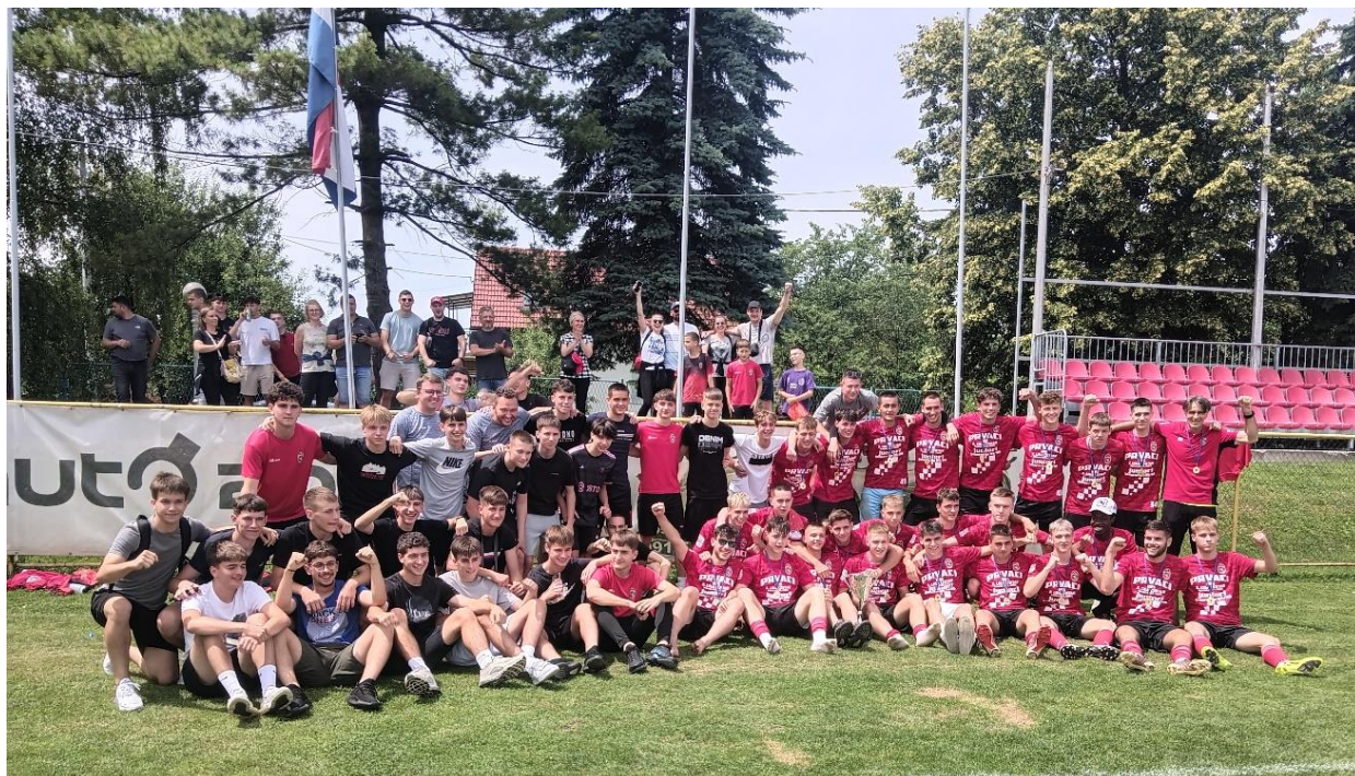
Igrači juniora i kadeta NK Kurilovec

Posebna čestitka igračima i vodstvu momčadi juniora za osvojeno 1.mjesto u Drugoj NL za juniore.