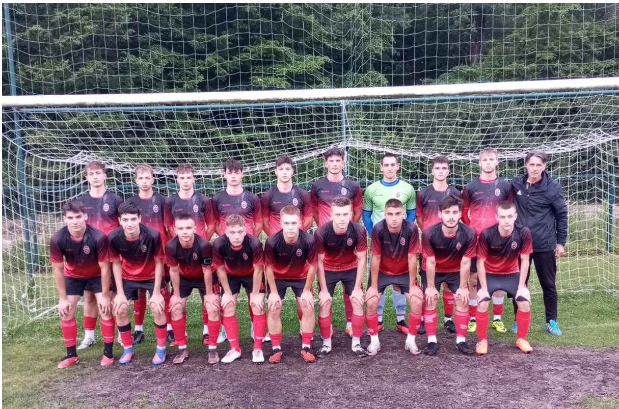
Momčad juniora NK Kurilovec